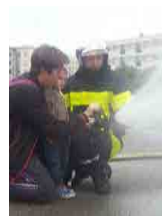
Visite chez les pompiers