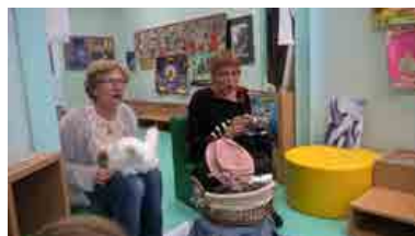
Contes échanges avec la Lueur des Contes