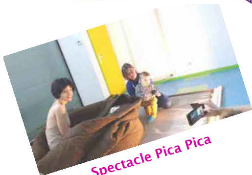
Spectacle Pica Pica